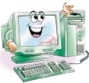
คอมพิวเตอร์ Energy Star