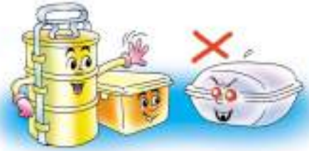
ใช้ปิ่นโตหรือใช้กล่องใส่อาหาร แทนการใช้กล่องโคม