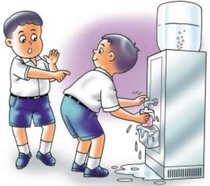
กดน้ำแต่พอดี อย่ากดจนล้นแก้ว