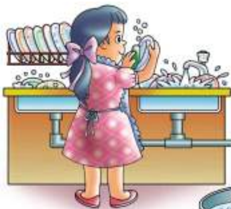
อย่าเปิดก๊อกน้ำไหลทิ้งขณะล้างจาน สิ้นเปลืองน้ำ