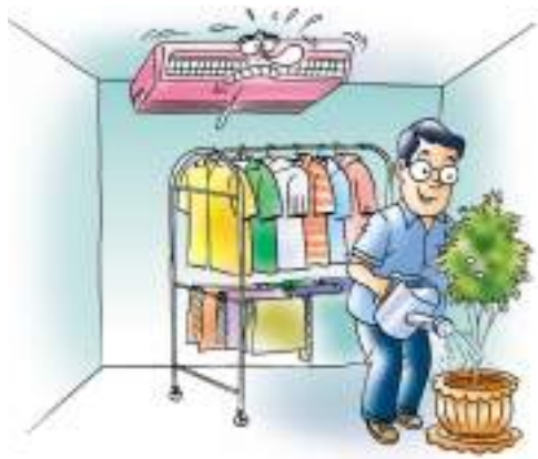
ไม่ปลูกต้นไม้ ไม่ตากผ้าในห้องที่มีการปรับอากาศ จะทำให้เครื่องปรับอากาศทำงานหนักขึ้น