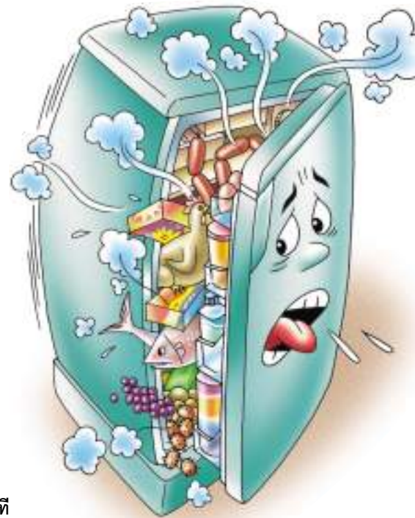
อย่าแช่อาหารจนแน่นตู้เย็น