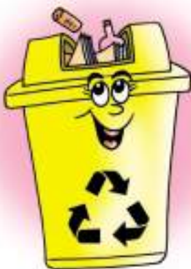
ถังขยะแห้ง