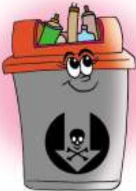
ถังใส่ขยะอันตราย