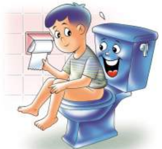
ควรดึงกระดาษชำระเท่าที่จำเป็นต้องใช้