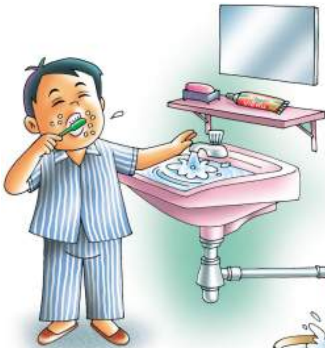
อย่าเปิดก๊อกน้ำทิ้งไว้ในขณะแปรงฟัน จะสิ้นเปลืองน้ำ