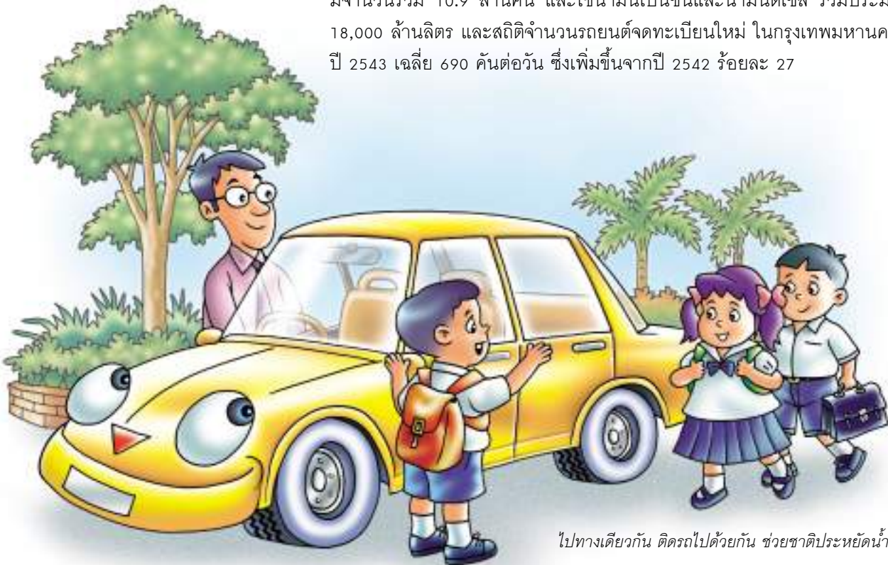
ไปทางเดียวกัน ดิครถไปด้วยกัน ช่วยชาติประหยัดน้ำมัน