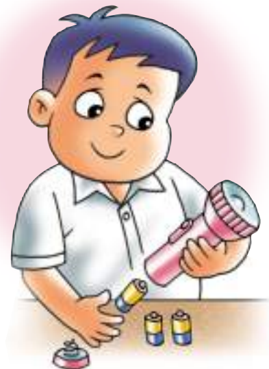
ควรใช้ถ่านไฟฉายชนิดที่สามารถบรรจุไฟได้ใหม่

นักเรียนอย่าลืมแนะนำคุณแม่ หันมาใช้ถ่านไฟฉายที่สามารถบรรจุไฟได้ใหม่ ถึงแม้ว่าถ่านไฟฉายชนิดนี้จะมีราคาแพงกว่าชนิดธรรมดา แต่ถ้าเทียบกับการซื้อถ่านไฟฉายชนิดธรรมดาหลายๆ ครั้ง ผลโดยรวมในระยะยาวของการใช้ชนิดบรรจุไฟได้ใหม่จะมีราคาถูกกว่า และยังช่วยลดจำนวนขยะอันตรายลงอีกด้วย