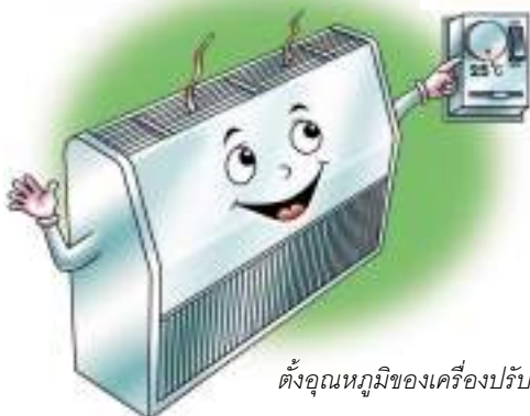
ตั้งอุณหภูมิของเครื่องปรับอากาศให้เหมาะสมคือที่ 25 °C