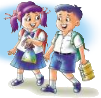
ใช้ถุงผ้าเมื่อไปซื้อของหรือจ่ายตลาด