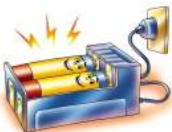
ممคือ Rechargeable Battery