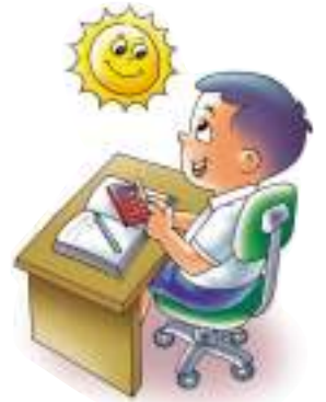
ใช้เครื่องคิดเลขพลังงานแสงอาทิตย์