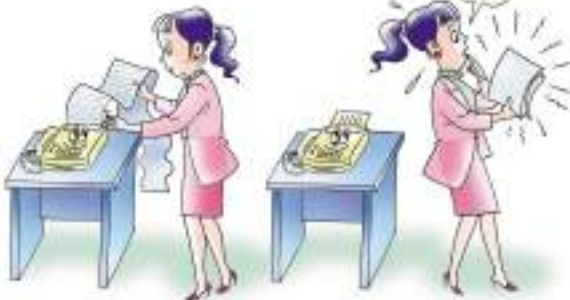
ชนิดใช้กระดาษไวต่อความร้อน