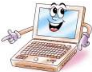
คอมพิวเตอร์ชนิดกระเป๋าหิ้ว