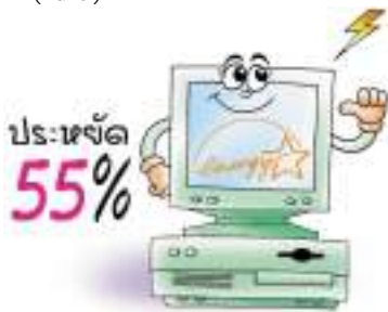
คอมพิวเตอร์ Energy Star

● ซื้อคอมพิวเตอร์ที่มีระบบประหยัดพลังงาน (Energy Management) เช่น คอมพิวเตอร์ที่มีสัญลักษณ์ Energy Star คอมพิวเตอร์ชนิดนี้จะใช้กำลังไฟฟ้าเท่ากับคอมพิวเตอร์ทั่วไปในขณะที่ใช้งาน (Active) แต่จะใช้กำลังไฟฟ้าลดลงร้อยละ 55 ในขณะที่รอทำงาน หรือเมื่อไม่ได้ใช้งานในระยะเวลาที่กำหนด (Idle)