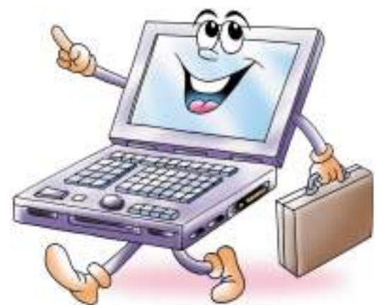
คอมพิวเตอร์ชนิดกระเป๋าหิ้ว

● ควรซื้อจอภาพที่ขนาดไม่ใหญ่จนเกินไป เช่น จอภาพขนาด 14 นิ้ว ใช้พลังงานน้อยกว่าจอภาพขนาด 17 นิ้ว ถึงร้อยละ 25