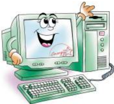
คอมพิวเตอร์ชนิดตั้งโต๊ะ

“คอมพิวเตอร์” เป็นอุปกรณ์ที่ใช้ในการจัดพิมพ์ข้อมูล การวิเคราะห์และประมวลผลข้อมูลในเวลาอันรวดเร็ว ถูกต้องและแม่นยำ และยังเป็นอุปกรณ์ที่ช่วยในการค้นคว้าหาข้อมูล ติดต่อสื่อสารกับแหล่งข้อมูลทั่วทุกมุมโลก เราสามารถแบ่งคอมพิวเตอร์ ออกเป็น 2 ส่วน คือ ตัวเครื่องคอมพิวเตอร์ และ จอภาพ