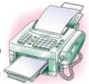
แบบเลเซอร์