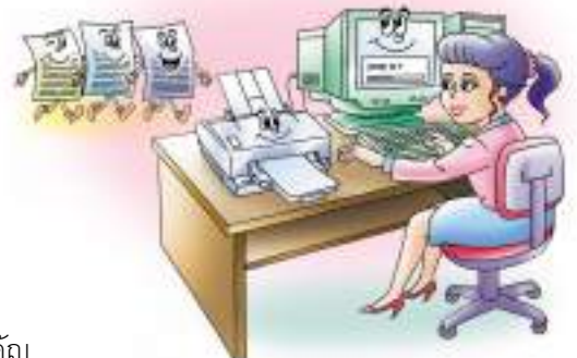
ตรวจทานข้อความก่อนสั่งพิมพ์